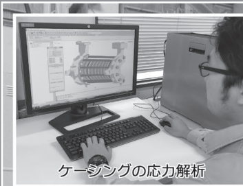
ケーシングの応力解析