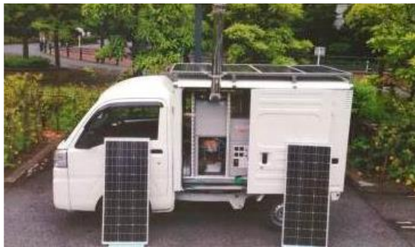
スターリングエンジンとソーラーパネルによる 移動電源車(芝浦工業大学)