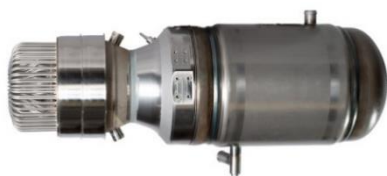
Qnergy PCK80 7kW フリーピストン形エンジン