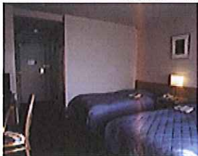
ツインルーム/一例