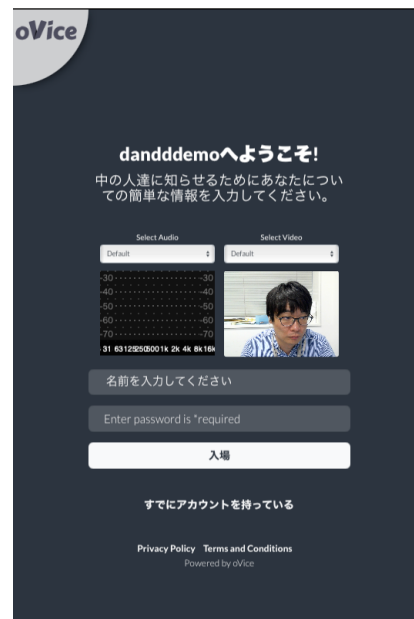
図 1 入力画面

(3) 接続すると図 2 のように 2D のバーチャル空間に入ります。自分のアイコンをドラッグす