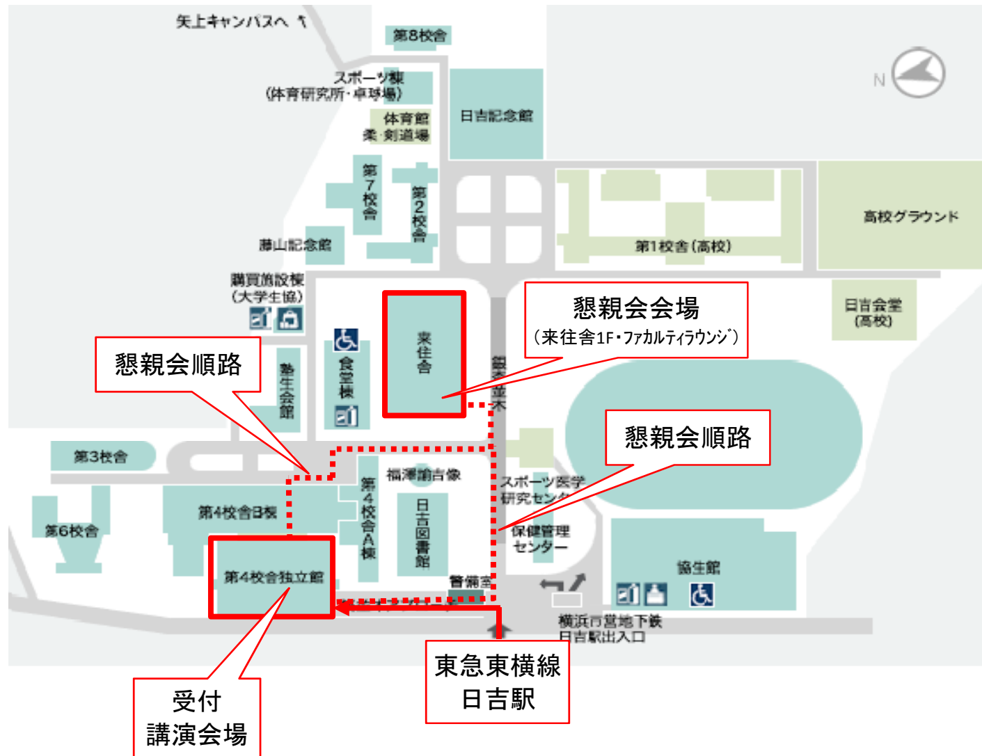
会場 日吉キャンパスマップ