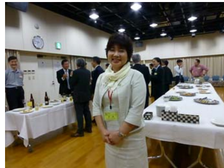
会場担当を終え安堵の比土平幹事