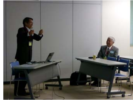
意見交換中の主査と幹事