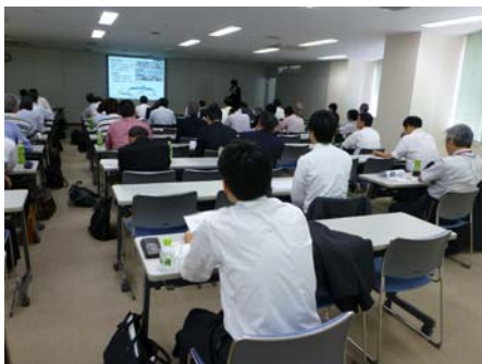
岡田氏の特別講演