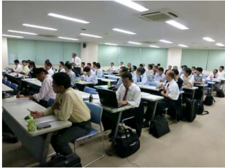
意見交換中の会場