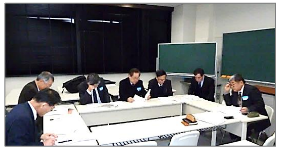
第 1 回「振動・音響」同好会の様子 (@徳島大学) まずは自己紹介から。30 年前の苦労話も出てきました。