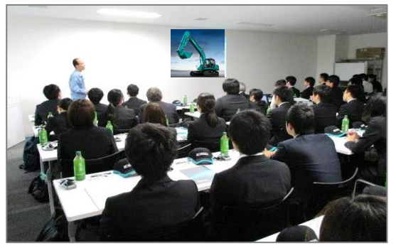
第 2 回企業見学会の様子 (コベルコ建機様訪問) 地元大学の学生さんも多く参加されました