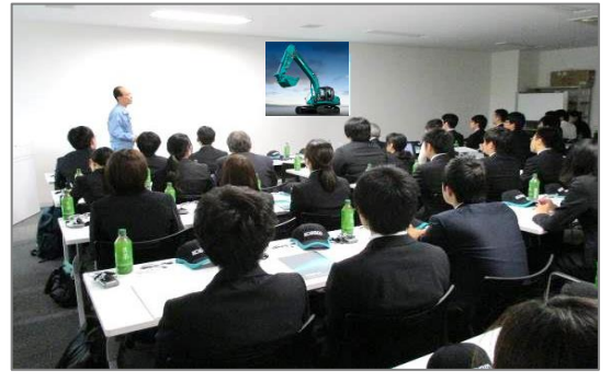
第 2 回企業見学会の様子 (コベルコ建機様訪問) 地元大学の学生さんも多く参加されました