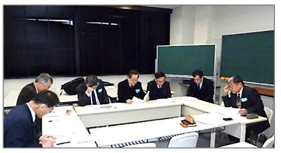
第 1 回「振動・音響」同好会の様子 (@徳島大学) まずは自己紹介から。30 年前の苦労話も出てきました。