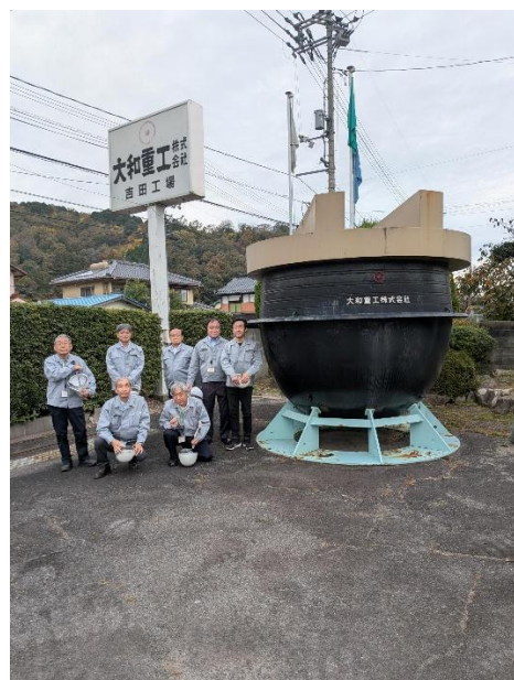
吉田工場前で。向かって右の巨大羽釜は、戦時下で多く生産されたようです