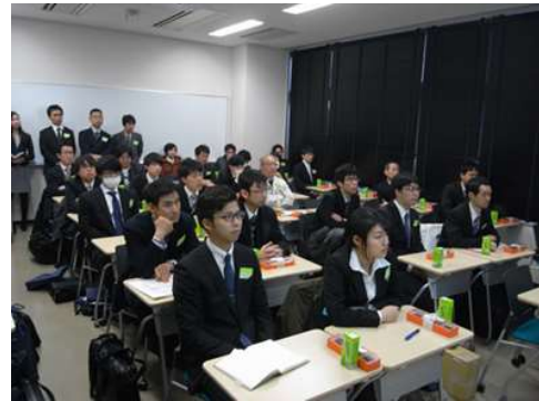
新企画（企業プレゼン・座談会）