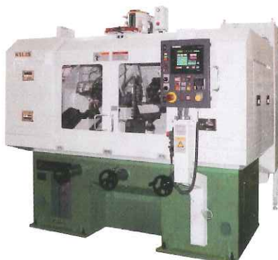
心なし歯車ラッピング盤

ピカピカに磨く事で、いろんな能力が生まれます。夢がある歯車の「歯」を磨く機械です。