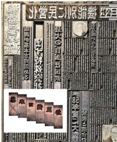
活字の母型と新聞組版

熊本日日新聞社は、日本初の新聞博物館を1987(昭和62)年に開設した。ここでは、原稿の組版から印刷、発行までの工程とその技術の変遷を知ることができる。