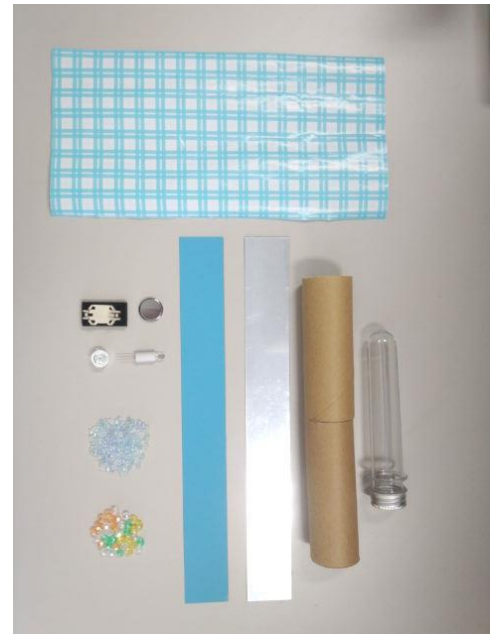
・主な工作パーツ