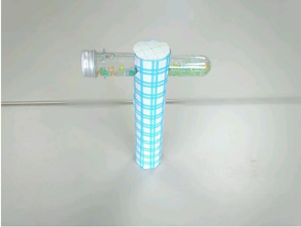
・LED ワンドタイプ万華鏡