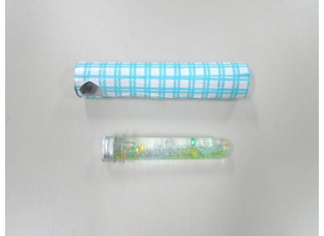
・万華鏡本体とオイルワンド