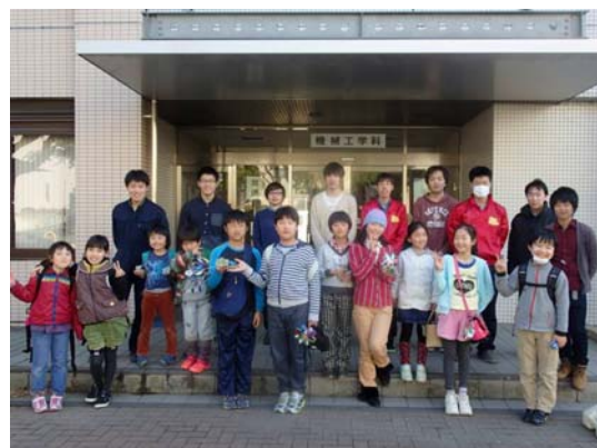
図5 参加者と記念撮影