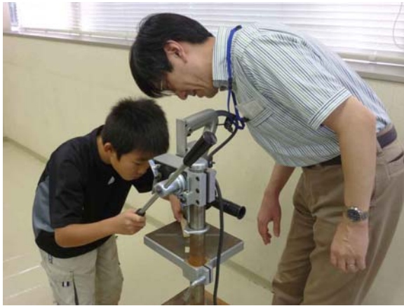
図 ボール盤による加工