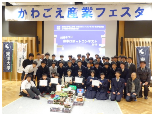
図4 全員で記念撮影 (文責：窪田佳寛（東洋大学）)