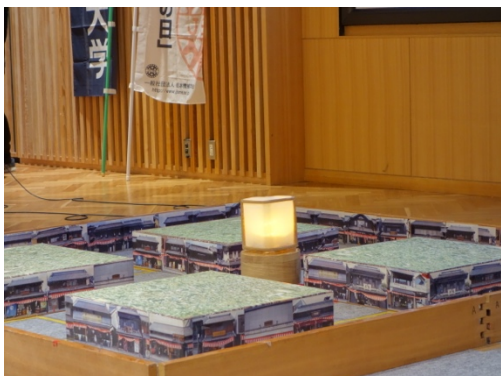
図1 前半の単体競技

審査員特別賞（東洋大学機械工学科同窓会賞）：狭山工業高等学校 チーム狭工03 「TRY号」