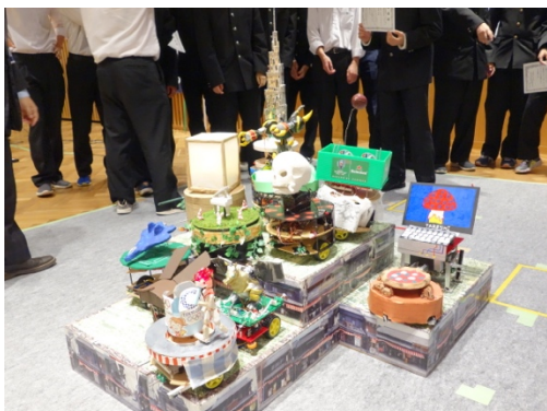
図3 コンテストに参加したロボット