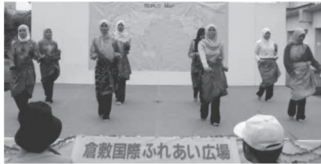
図3 マレーシアの踊りをする様子