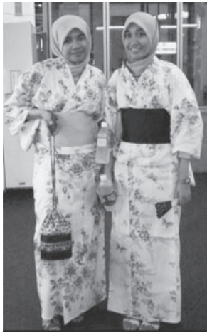
図2 花火大会に行く前のゆかた姿