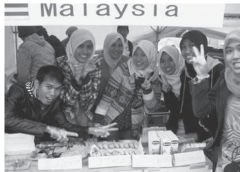
図4 あかいわ祭りでのマレーシアのブース

学会で口頭発表をさせてもらい、非常に貴重な経験ができた(図1)。発表資料の準備や原稿の作成など大変時間がかかったが、とても自分自身の勉強になった。その経験は今後マレーシアの大学の博士課程に進学したときには必ず役に立つと思う。日本の大学院で研究生生活を送れたことは私にとって大変幸運だった。