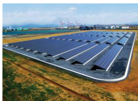
電源開発(株)若松事業所

講演会前日の2011年7月15日(金)には、安川電機ロボット工場・新日鐵高速レール試験機とともに、上記次世代エネルギーパークやエコタウン実証研究エリアの見学を予定しております(交渉中です)。講演会参加者は無料ですので、皆様の見学会への参加をお待ちしております。