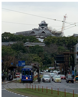
図2 復旧されつつある熊本城