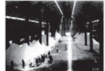
1931年 国産法による窒素肥料の製造に成功 (昭和肥料(株))