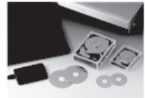
2005年 垂直磁気記録方式ハードディスクの量産開始