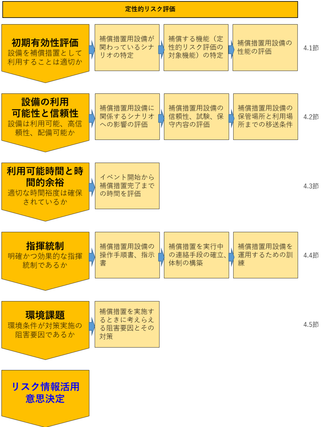
図 1：DB 設備の OLM 実施時の定性的リスク評価における検討事項